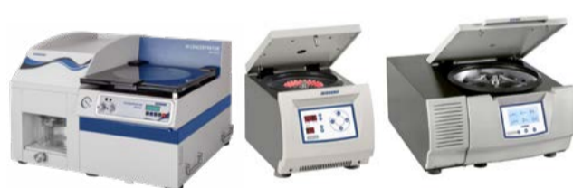
真空离心浓缩 / 离心机