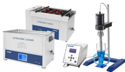
超声波清洗 / 超声波破碎