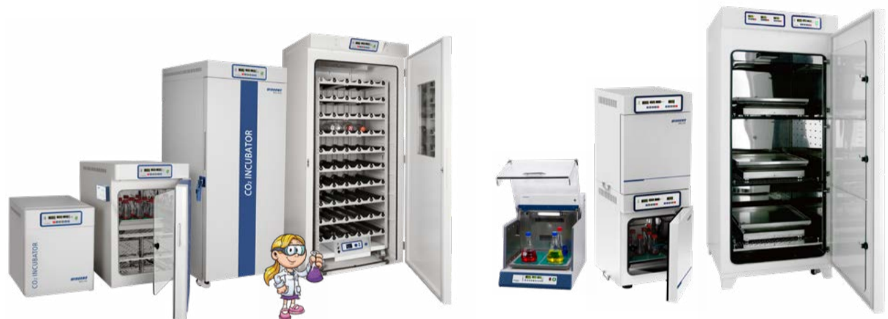
CO 2 培养箱 / 三气培养箱 / CO 2 振荡培养箱