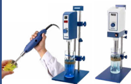
高剪切均质乳化机