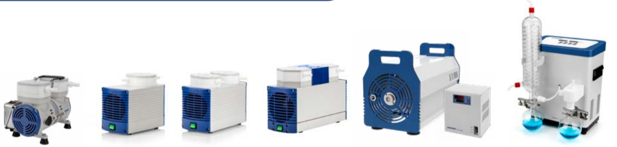
防腐蚀隔膜真空泵 / 变频泵